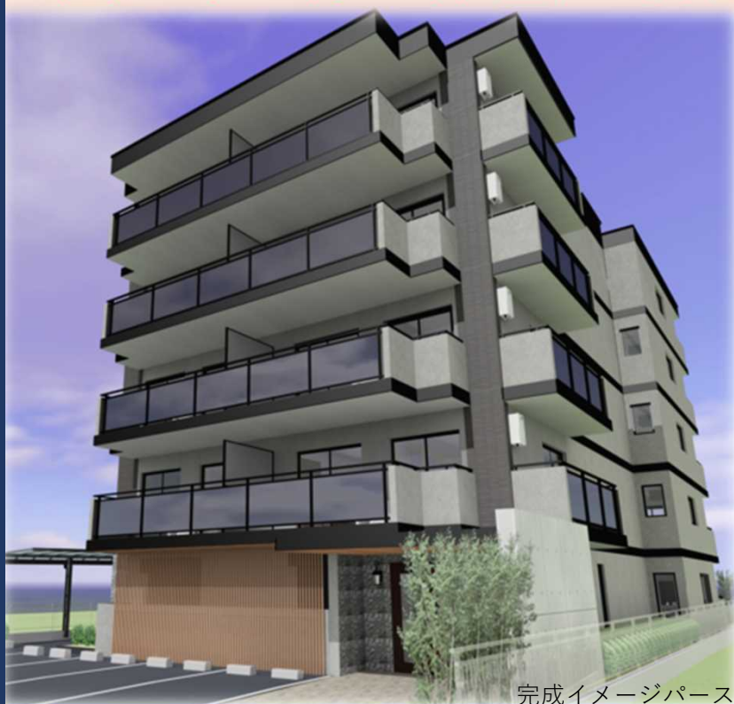
完成イメージパース